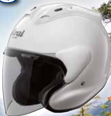
X-TEND RAM White

Il casco aperto X-tend RAM offre di più: più protezione, più comfort e più ventilazione regolabile. Ma anche una migliore vestibilità, senza compromettere la sensazione di libertà e l'eccellente visione che solo un casco aperto può offrire. La calotta esterna dell' X-tend RAM è caratterizzata da lati inferiori più estesi di 3 centimetri per un maggiore comfort e sicurezza. I nuovi supporti e gli sfoghi laterali coperti completano lo splendido design di questo eccezionale casco da turismo.